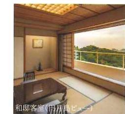
和邸客室(月島ビュー)