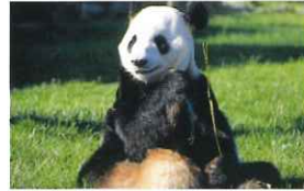
アドベンチャーワールド