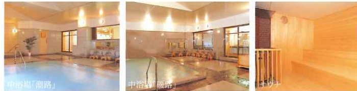
すずしゆ 貸切かけ流し温泉 生絹湯