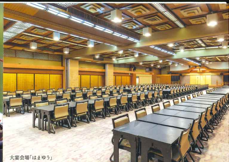
大宴会場「はまゆう」