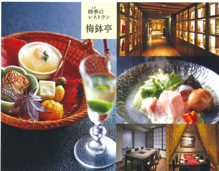
時季の レストラン 梅鉢亭