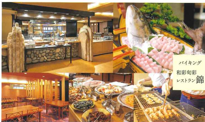
バイキング 和彩旬彩 レストラン 錦