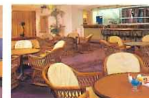
ラウンジ「コーラルリーフ」